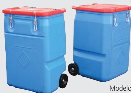
Modelos Service Box