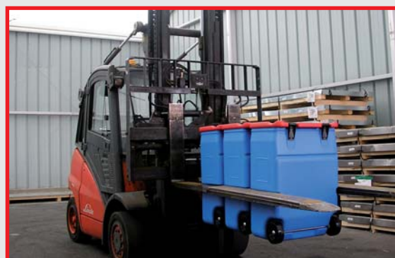
Directamente con pinzas